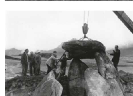
1974. Trikuharriaren zaharberritze lanak. Obras de restauración del dolmen.