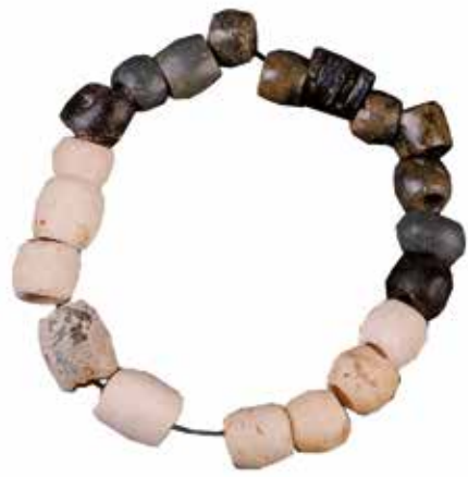
Trikuharrian aurkituriko giza apaingarriak. Elementos de adorno personal hallados en el dolmen.

La mayor parte de estos materiales se conservan en el Bibat. Museo de Arqueología de Álava (Vitoria-Gasteiz).